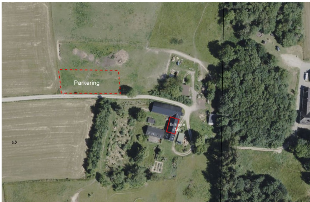
Luftfoto med markering af den del af bebyggelser der anvendes i forbindelse med det ansøgte.

Aktiviteter afholdes på egen grund, indenfor eksisterende bebyggelse, i den tidligere staldbygning, som markeret på nedstående illustration.